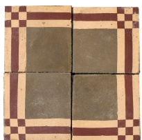
A PZ 52